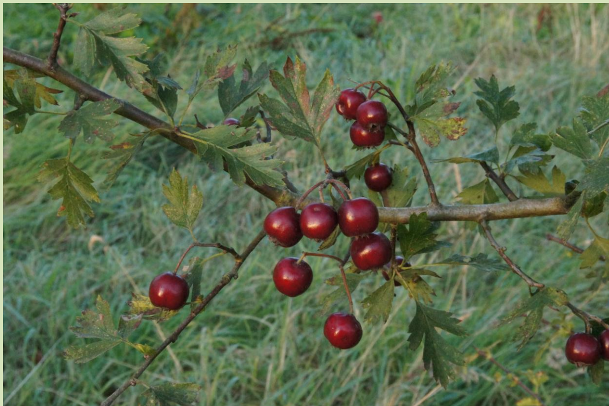
Crataegus monogyna 'Lasiocarpa'

Eind december is langs de oprit van het arboretum met 21 stelconplaten een nieuwe parkeer- en opslagplaats gecreëerd. Nu kan het grondmengsel "Huisman Extra" en ander los te storten organische materiaal "schoner" verwerkt worden. Momenteel is het nogal modderig bij de ingang, maar dat zal langzamerhand verbeteren.