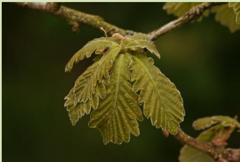
Quercus dentata 'Carl Ferris Miller'

Het jaar 2012 was een turbulent jaar voor het arboretum; een korte, maar strenge winterperiode veroorzaakte meer schade dan was ingecalculeerd bij het verzamelen van het sortiment en doordat het naast het arboretum gelegen terrein, ook beplant met een deel van de collectie, verkocht werd en ontruimd moest worden..